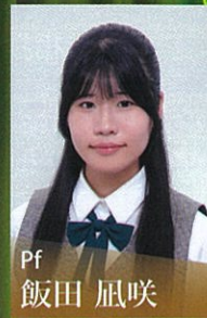
Pf 飯田 凧咲