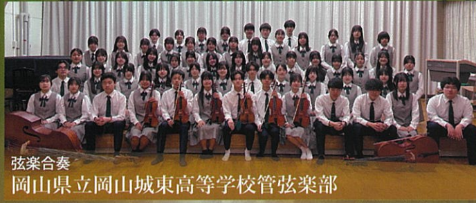
弦楽合奏 岡山県立岡山城東高等学校管弦楽部